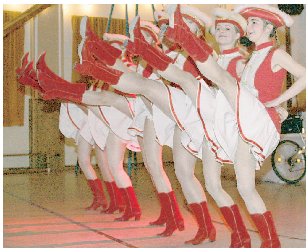
Hoch das Bein: Auch die Tänzerinnen hätten mehr staunende Besucher verdient gehabt.

aik“. Am Samstag, 11. März, um 11 Uhr gibt Diplom-Ingenieur Andreas Stemberg bei Solaranlagen warmes Wasser und Gebäudetechnik in Lage in zwei Unterrichtsstunden einen Überblick. Weitere Infos und Anmeldungen unter ☎ (05232) 702713 oder (05232) 702729.