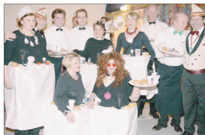
Das menschliche „Frühstücksbüffet“: Diese lustige Truppe gewann beim Kostümwettbewerb den dritten Platz.

Gestern Nachmittag regierten die Nachwuchs-Narren un-